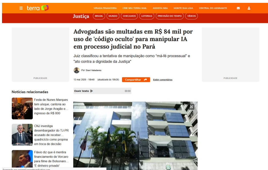
Figura 6 https://www.terra.com.br/noticias/justica/advogadas-sao-multadas-em-r-84-mil-por-uso-de-codigo-oculto-para-manipular-ia-em-processo-judicial-no-para,2a4be5cd27d550a68162e7392cf1b911zvuxx52w.html