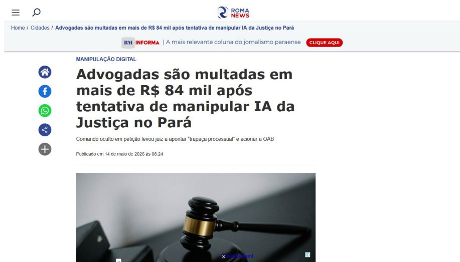
Figura 7 https://www.romanews.com.br/cidades/advogadas-sao-multadas-em-mais-de-r-84-mil-apos-tentativa-de-manipular-ia-da-justica-no-para-0526

Finalmente, é importante destacar que em uma dessas reportagens de mídia nacional consta que as advogadas Representadas apresentaram nota conjunta com o seguinte teor: