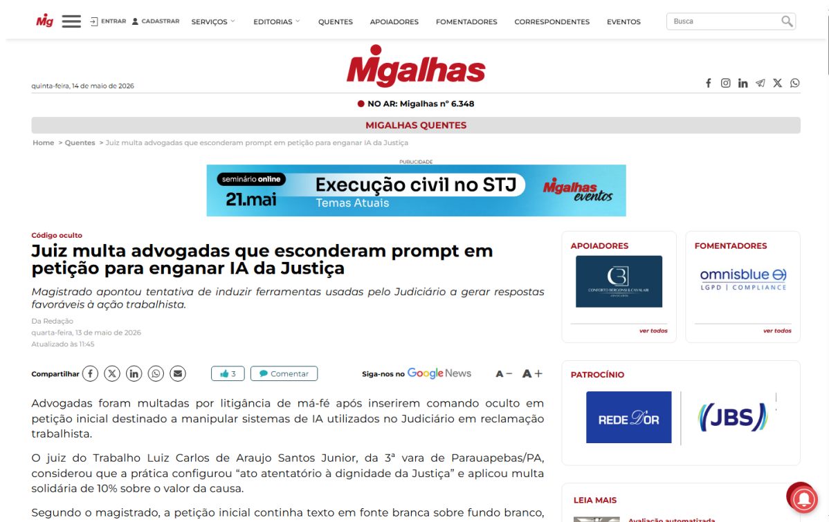
Figura 1 https://www.migalhas.com.br/quentes/455817/juiz-multa-advogadas-que-esconderam-prompt-para-enganar-ia-da-justica

O episódio alcançou expressiva repercussão nos meios de comunicação em âmbito nacional, conforme documentam os registros jornalísticos das matérias abaixo: