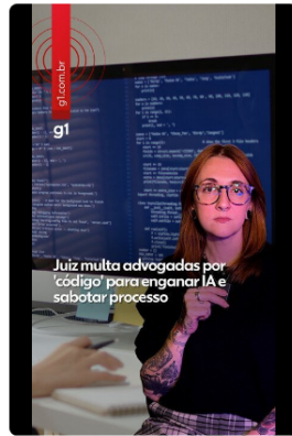
Juiz multa advogadas em R$ 84 mil por 'código secreto' para enganar IA e sabotar processo

O caso das duas advogadas multadas no Pará após tentarem enganar a inteligência artificial de um tribunal envolveu o uso de um "código secreto" para mudar as instruções do sistema.