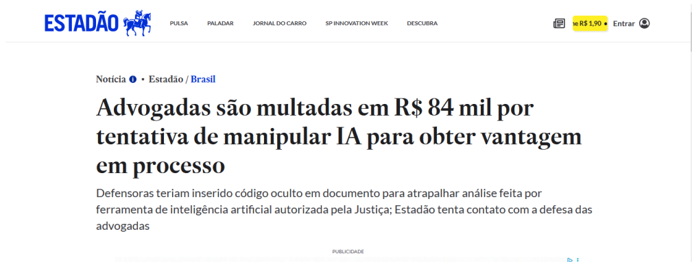
Figura 5 https://www.estadao.com.br/brasil/advogadas-multadas-84-mil-tentativa-manipular-ia-obter-vantagem-processo-npr/